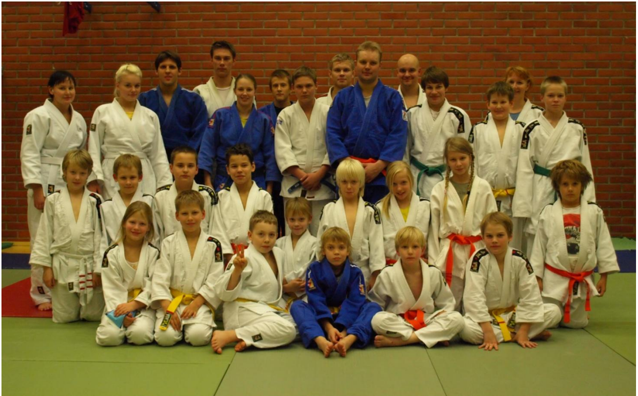
Kuva 5. Sakuralaisia Lapinlahden alueleirillä marraskuussa 2008.