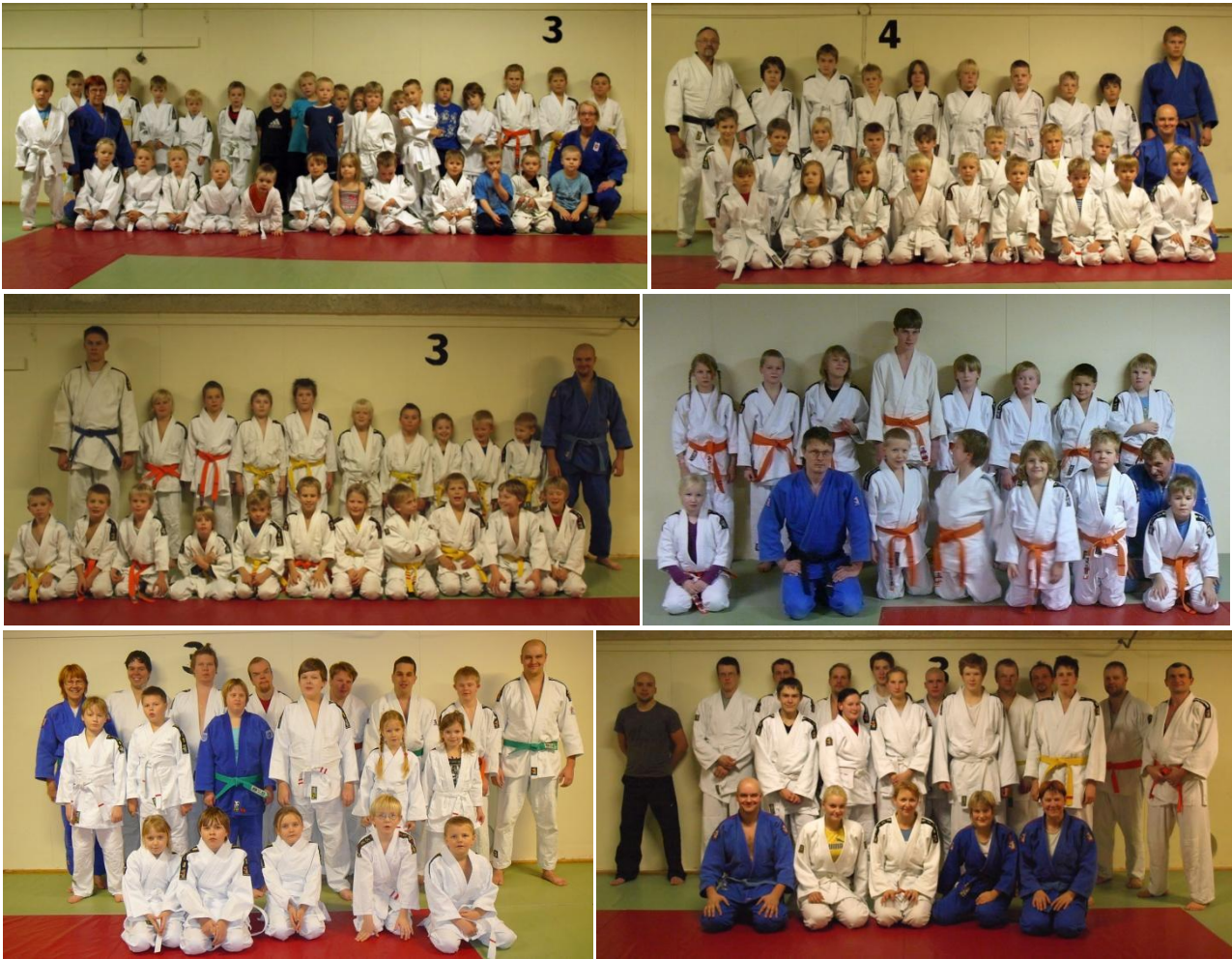
Kuva 3. Judoseura Sakuran ryhmiä vuonna 2008: yläriivi: muksujudoryhmä ja Lasten judokoulu. Keskiriivi: Lasten jatkoryhmä ja Nuorten jatkoryhmä. Alarivi: Sovellettu judo ja Kuntojudo.