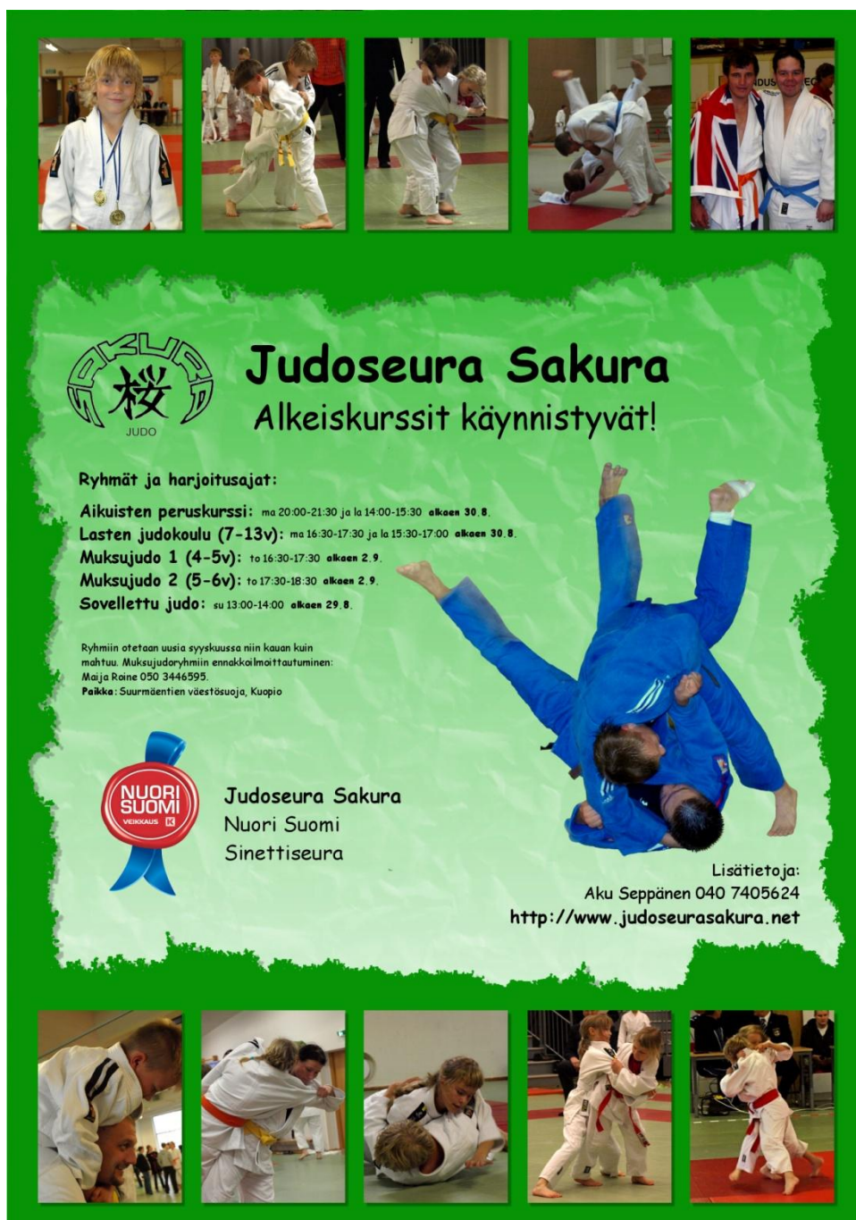
Kuva 8. Sakuran Peruskurssimainos, syksy 2010.

Alkavista peruskursseista ilmoitettiin omalla ilmoituksella Viikko Savo -lehdessä. Lisäksi oltiin mukana Kuopion Danit ry:n yhteismainoksessa Kuopion Kaupunkilehdessä. Peruskurssimainoksia vietiin päiväkotien, koulujen, kirjastojen, kauppojen, ym. yleisten paikkojen ilmoitustauluille Kuopiossa ja Siilinjärvellä. Peruskursseista ilmoitettiin myös internet -kotisivuilla.